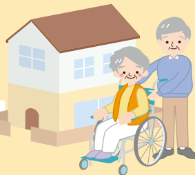
[高齢者] 介護予防・自立支援