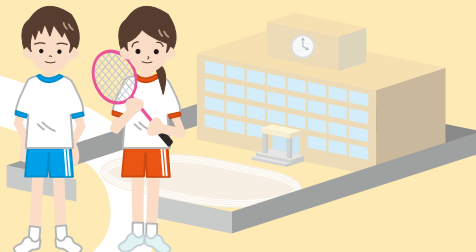
[学生]スポーツ・健康づくり