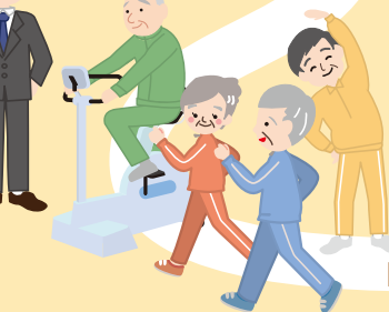
[心筋梗塞・心不全になった人] リハビリテーション・ 日常生活指導