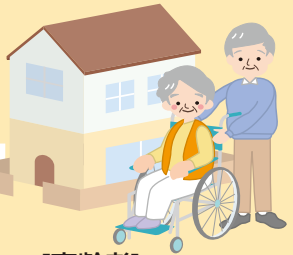
[高齢者]介護予防・自立支援