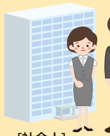
[社会人]就労支援 生活習慣病予防