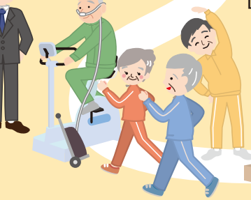
[中年～高齢者]慢性閉塞性肺疾患(COPD)予防