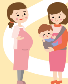
[女性の健康] 日常生活指導・相談