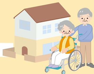
[高齢者] 介護予防・自立支援