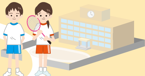
[学生]スポーツ・健康づくり