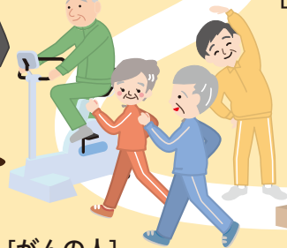
[がんの人] 理学療法