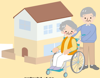
[高齢者]介護予防・自立支援