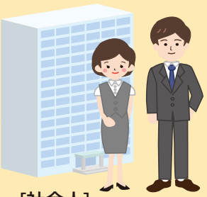
[社会人]就労支援 生活習慣病予防