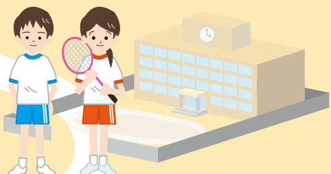
[学生]スポーツ・健康づくり