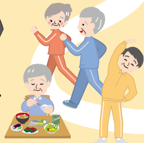
[栄養、嚥下]理学療法