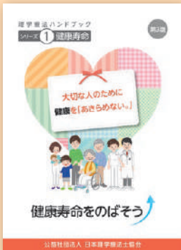
シリーズ① 健康寿命

日本理学療法士協会は、健康について疑問や悩みを持っている国民を対象として、「疾病予防・健康増進についてわかりやすく伝える1冊」をコンセプトに、理学療法ハンドブックを作成しています。