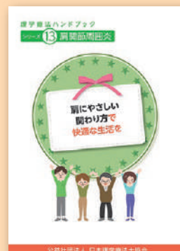
シリーズ⑬ 肩関節周囲炎