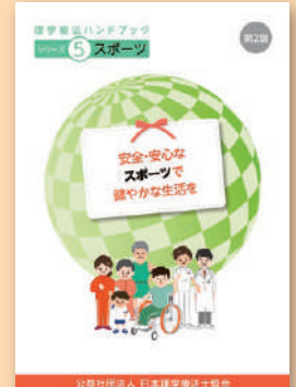
シリーズ⑤ スポーツ