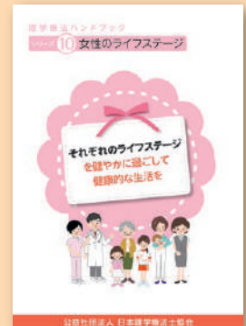
シリーズ⑩ 女性の ライフステージ