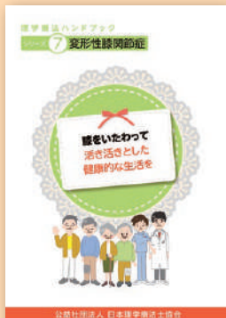
シリーズ⑦ 変形性関節症