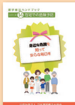
シリーズ⑭ 在宅での 危険予防