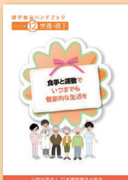
シリーズ⑫ 栄養・嚥下