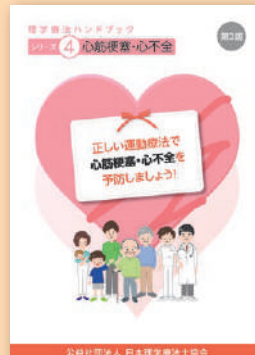
シリーズ④ 心筋梗塞・心不全