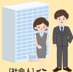
[社会人]就労支援 生活習慣病予防