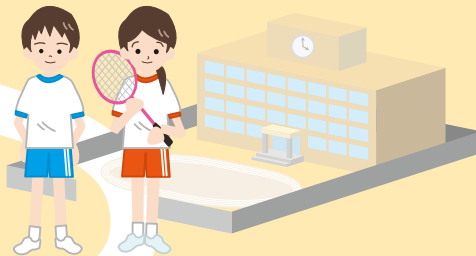
[学生]スポーツ・健康づくり