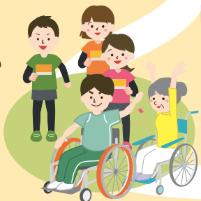
[外傷・障がい予防]リハビリテーション・スポーツ