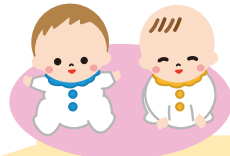
[赤ちゃん]発達支援

理学療法士は、「赤ちゃん」から「高齢者」までの人生のあらゆる場面でサポートします。みなさまがより良い人生をお送りできるよう、理学療法士は活動しています。