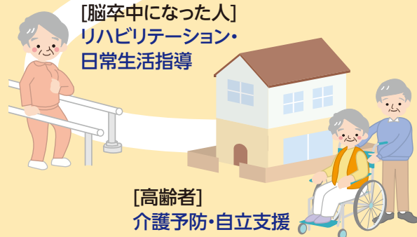
[高齢者] 介護予防・自立支援