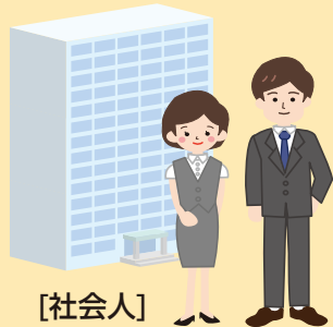
[社会人] 就労支援 生活習慣病予防