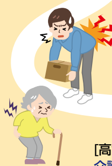
腰痛予防・ 適切な運動