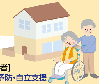
[高齢者] 介護予防・自立支援