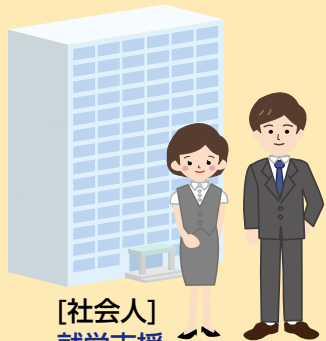
[社会人] 就労支援 生活習慣病予防