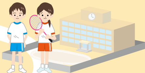
[学生]スポーツ・健康づくり