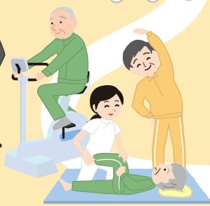
[変形性膝関節症の人]理学療法