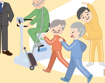
[中年～高齢者] 慢性閉塞性肺疾患 (COPD) 予防