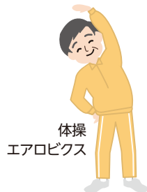
体操 エアロビクス