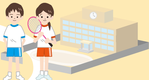
[学生]スポーツ・健康づくり