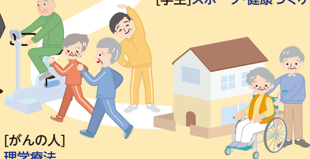
[がんの人] 理学療法