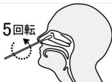
鼻腔ぬぐい液採取