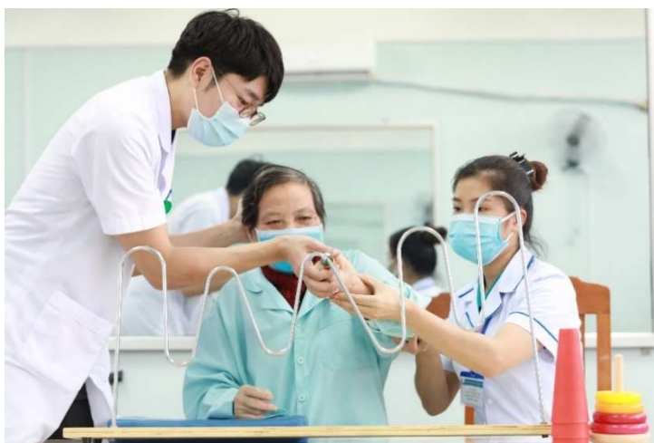
↑ (ベトナムで活動する理学療法士隊員)

JICA 海外協力隊は、開発途上国や、中南米地域の日系人社会からの要請に基づき派遣され、現地の人々と共にその国や地域の課題解決に取り組みます。長期の派遣期間は原則2年間です。現地では、異文化社会における相互理解も深め、帰国後は、日本や世界で協力隊経験を生かした活躍が期待されています。